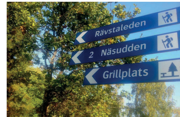
Rävsta är ett populärt friluftsområde med markerade stigar, bad- och grillplatser.

I Steningehöjden växer en helt ny stadsdel fram. Och direkt runt hörnet ligger Rävsta naturreservat med blomsterrika beteshagar, ljusa skogar och uppskattade badplatser.