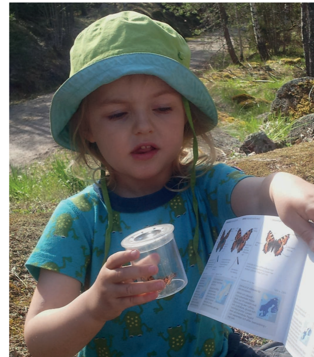
Även för barn finns mycket att upptäcka på våra naturguidningar.

Mer information i guidefoldern ”Augusti – oktober” som ges ut under sommaren.