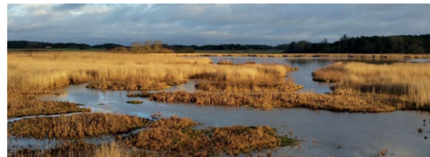
Utsikt från fågelornet.