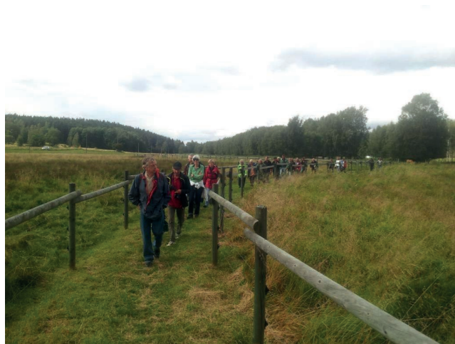
Naturguidning i Steningedalens naturreservat.

Turerna leds av erfarna naturguider som har mycket spännande att berätta om våra djur och växter och kan svara på många frågor om naturen.