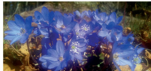
Blåsippor vid Steninge allé.