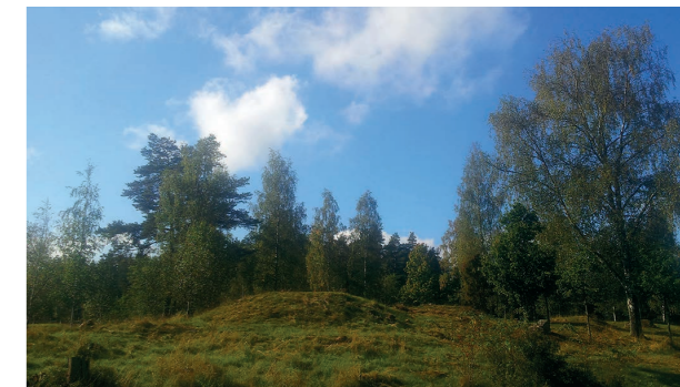
På Rävsta gravfält finns många lämningar från järnåldern.