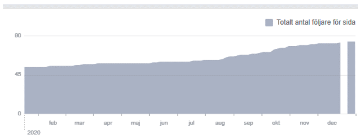
Figur 2 Facebook Totalt antal följare

Vår Facebooksida Naturskyddsförening Sigtuna har uppdaterats kontinuerligt, se figur 2.