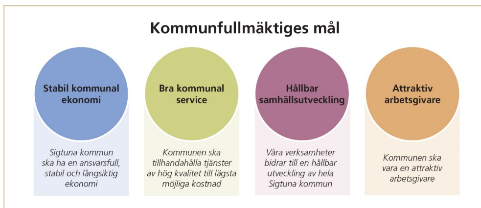
Figur 1. Kommunfullmäktiges fyra mål; Stabil kommunal ekonomi, Bra kommunal service, Hållbar samhällsutveckling och Attraktiv arbetsgivare.

Ett av kommunens övergripande mål är att kommunens verksamheter ska bidra till en hållbar utveckling av hela Sigtuna kommun. Enligt kommunens Mål och budget 2020-2022 ska arbetet med en hållbar utveckling genomsyra kommunens verksamheter och integreras i servicen till invånare och olika samhällsaktörer som näringsliv och civilsamhällets organisationer. För bästa resultat krävs att hållbarhetsfrågorna är integrerade i alla verksamheter och att alla hållbarhetsdimensionerna som är ömsesidigt beroende av varandra hanteras samtidigt.