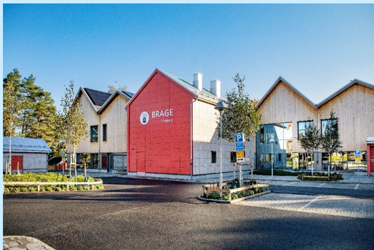
Figur 5. Brage Förskola

Brage förskola byggdes som ett passivhus och uppfyller kriterierna för Miljöbyggnad Silver. Byggmaterialet är i enlighet med Naturskyddsföreningens koncept för giftfri förskola. På förskolans tak, som är vända mot söder för störst effekt, finns solceller som producerar förnybar energi. Passivhus är byggnader som "passivt" värms upp via solen, interna värmevinster och återvunnen värme i ventilationssystem. Detta medför en värmeenergibesparing på upp till 75% jämfört med byggnader som uppfyller de kommande kraven i Boverkets byggregler.