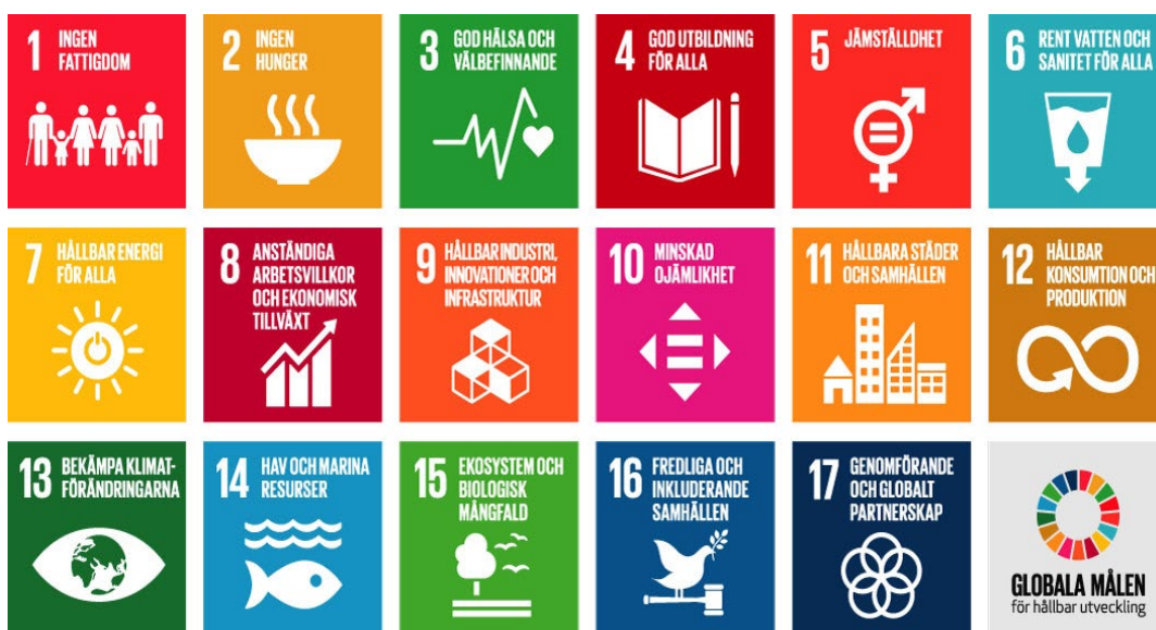
Figur 2. FN:s 17 globala mål för en hållbar utveckling till år 2030.

”Det snabbaste och mest effektiva sättet att genomföra Agenda 2030 och nå den omställning som krävs är att använda kraften i ordinarie processer. Agenda 2030 och hållbar utveckling måste integreras i den dagliga verksamheten och kan inte vara ett projekt vid sidan av.” (Agenda 2030-delegationen 1 )