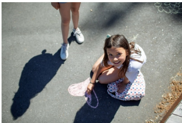
Figur 3. Leende barn ritat ett rosa hjärta med krita på asfalt.

Vissa förvaltningar genomför egna utbildningar kring barnrättsfrågor vid introduktion av nyanställda. Andra förvaltningar har genomfört utbildningar för en större andel medarbetare.