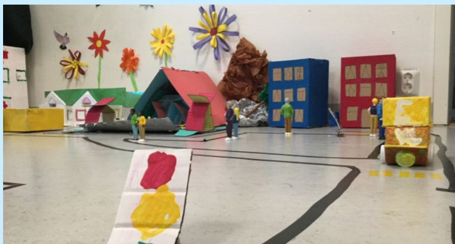
Figur 10. Bild på en del av Kärleksstaden som består av hus och trafikljus av kartong, blommor av papper, leksaksmänniskor och vägar markerade på förskolans golv.

I Kärleksstaden finns bland annat vägar, sjukhus, en polisstation, ett apotek, blommor och träd, ett badhus, djur och människor och hjärtan och stjärnor.