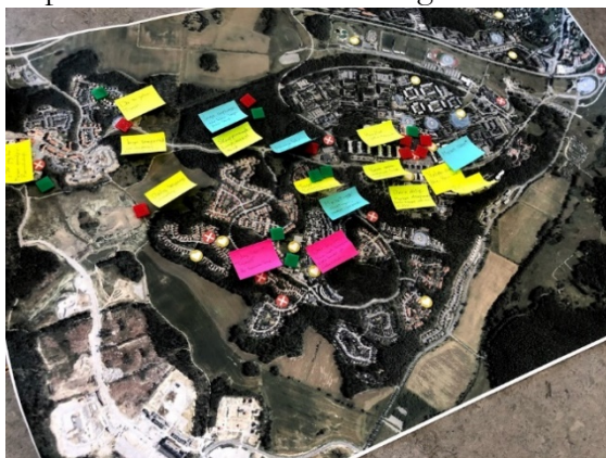
Figur 4. Karta över Steningshöjden med markerade platser

Eleverna fick peka ut och formulera synpunkter om bra och dåliga platser i sitt närområde och i hela Sigtuna kommun. Både på landsbygden och i tätorten tycker barnen att träffpunkter är viktigt, gärna i närheten av skolan. De saknade fler parker, lekplatser och aktiviteter. Många av barnen från Odensala skola bor utspritt och blir