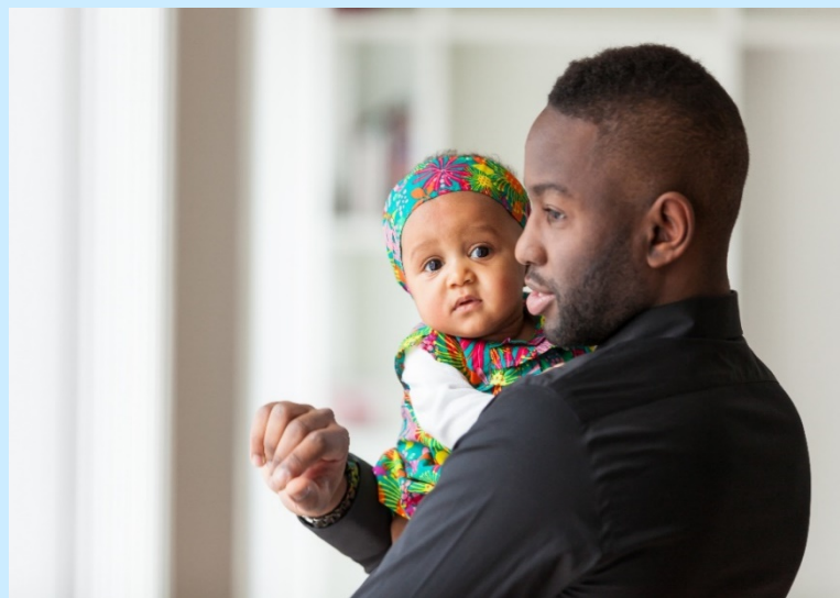
Figur 9. Man håller ett litet barn i famnen.

Syftet med insatsen är: ”Att med barnets bästa i fokus och lyhördhet för familjens egen kultur och kompetens förebygga ohälsa hos barn genom att stärka familjens tillit och förtroende för sin egen förmåga, stärka familjens delaktighet i samhället, tidigt upptäcka familjer med extra behov av stöd och erbjuda det”.